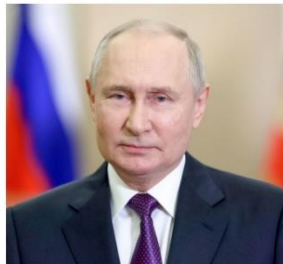
ПУТИН ВЛАДИМИР ВЛАДИМИРОВИЧ

1984 года рождения; место жительства – город Москва; Государственная Дума Федерального Собрания Российской Федерации, депутат, заместитель Председателя Государственной Думы, член Комитета Государственной Думы по бюджету и налогам; выдвинут политической партией «Политическая партия «НОВЫЕ ЛЮДИ»; член политической партии «Политическая партия «НОВЫЕ ЛЮДИ», член Центрального совета партии