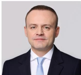
ДАВАНКОВ ВЛАДИСЛАВ АНДРЕЕВИЧ

1984 года рождения; место жительства – город Москва; Государственная Дума Федерального Собрания Российской Федерации, депутат, заместитель Председателя Государственной Думы, член Комитета Государственной Думы по бюджету и налогам; выдвинут политической партией «Политическая партия «НОВЫЕ ЛЮДИ»; член политической партии «Политическая партия «НОВЫЕ ЛЮДИ», член Центрального совета партии