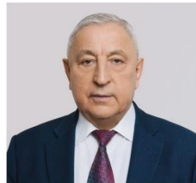
ХАРИТОНОВ НИКОЛАЙ МИХАЙЛОВИЧ

1968 года рождения; место жительства – город Москва; Государственная Дума Федерального Собрания Российской Федерации, депутат, руководитель фракции политической партии ЛДПР – Либерально-демократической партии России, председатель Комитета Государственной Думы по международным делам; выдвинут политической партией «Политическая партия ЛДПР – Либерально-демократическая партия России»; член политической партии «Политическая партия ЛДПР – Либерально-демократическая партия России», Руководитель Высшего Совета партии, Председатель партии