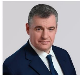
СЛУЦКИЙ ЛЕОНИД ЭДУАРДОВИЧ

1952 года рождения; место жительства – город Москва; Президент Российской Федерации; самовыдвиженец