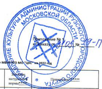
Значения натуральных норм, необходимых для определения базовых нормативов затрат на оказание муниципальных услуг, выполнение работ МБУ «ЦО МО "ЦС" на 2022 год