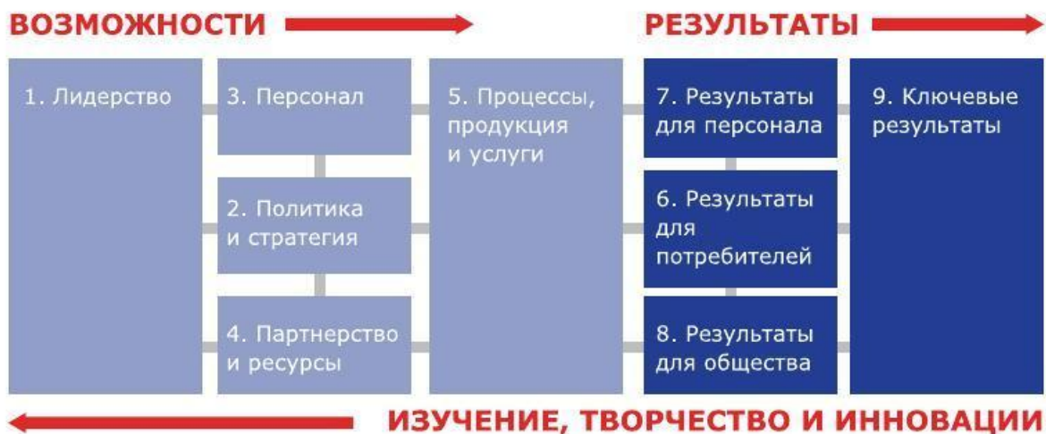
Рис. 1. Модель премии Правительства РФ в области качества

Организации-участники оцениваются в баллах по модели премии, включающей в себя две группы критериев: